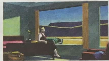
Edward Hopper, Western Motel (1957).