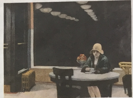
Edward Hopper, Automat (1927).